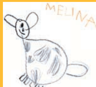
Melina / 5 Jahre