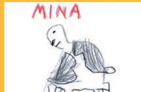
Mina / 5 Jahre